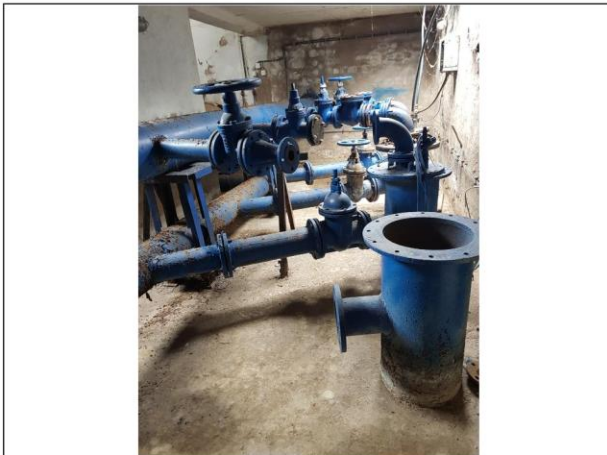
USIS I POTIS