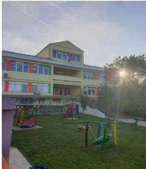
Објекат "Чаролија" Ириг