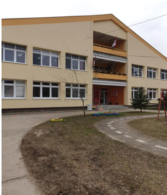
Објекат "Вила" Врдник